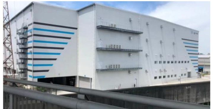
▲ロジクロス大阪の外観