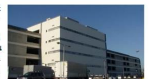
▲イースト・サーキュラー・ベース

■拠点・施設 オフィスバスターズ (東京都中央区) は22日、取引量が増加していることを受けて千葉県柏市の物流拠点「イースト・サーキュラー・ベース」(ECB) を7月に800坪増築し、3500坪に拡張したと発表した。同月1日には関西拠点の「WCB」を移転・拡張によって800坪規模に広げており、東西の物流スペースとして4300坪を確保した。新型コロナウイルス感染症拡大の影響で、2020年から21年にかけて中古オフィス需要を求める一般消費者のニーズが高まっているという。